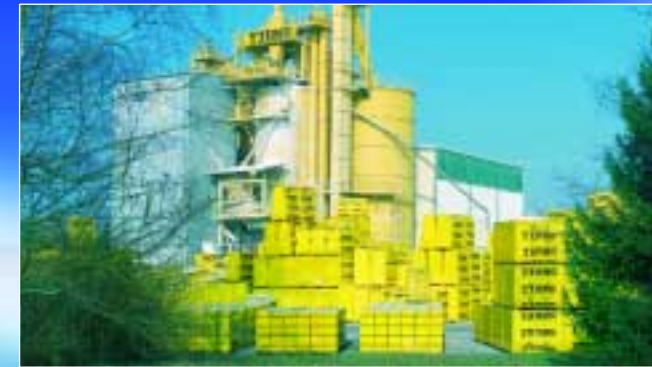
Lösungen für Kies-, Beton- und Steinwerke