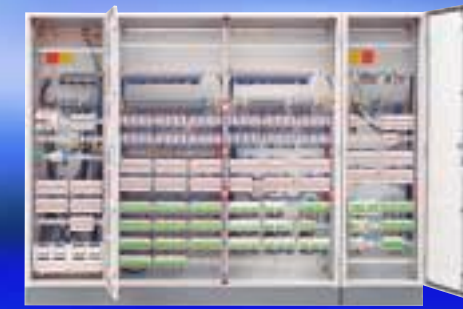
Installationsverteiler mit EIB-Bus Komponenten