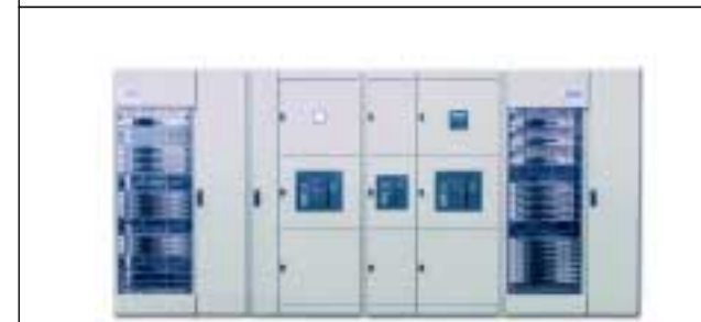
TSK-Schaltanlage 4000A Fabr.Schneider Electric GmbH Typ:PRISMA