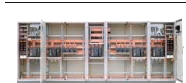
PTSK-Schaltanlage 2500A Fabr. Striebel&John Typ:XA

Unsere Schaltanlagen erfüllen selbstverständlich die neusten technischen Vorschriften und sind typgeprüft TSK (Typgeprüfte Schaltgerätekombinationen nach VDE 0660 Teil 500, EN 60439 Teil1).