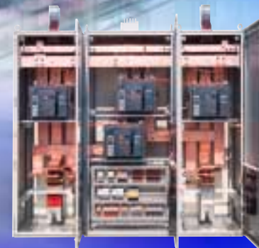
Umschaltanlage über Fernwirkanlage PTSK-Schaltanlage 2500A