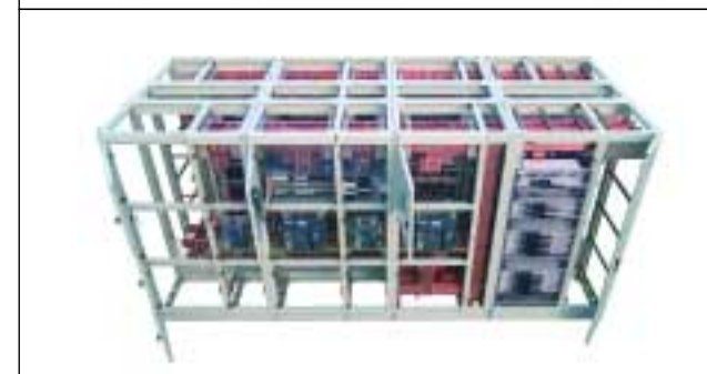
TSK-Schaltanlage 4000A Fabr.Schneider Electric GmbH Typ:PRISMA