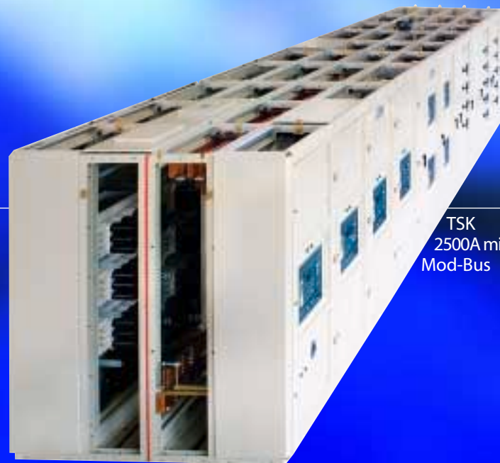
TSK 2500A mit Mod-Bus