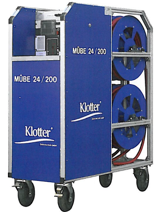
MÜBE 24/200: 400 kg, (B x L x H): 660 x 1400 x 1710 mm, leicht zu transportieren.

Wenig größer als ein Gefrierschrank, passt die MÜBE nahezu überall hin. Firmenchef Werner Klotter: „In die Konzeption des Geräts sind unsere Erfahrungen aus zahllosen Umbauarbeiten bzw. Wartungs-Einsätzen eingeflossen. Die Mobile Überbrückungseinheit ist die kostengünstige und umweltschonende Alternative zum Notstromaggregat,