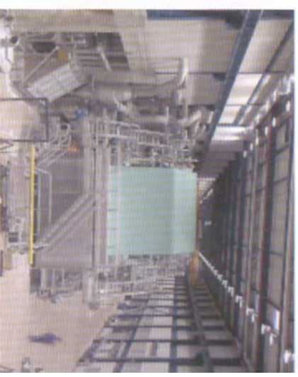
Die Klotter Elektrotechnik GmbH hat für die Papierfabrik Koehler AG insgesamt 250 Meter Mess- und Regelstränke für eine neue Papiermaschine und eine neue Streckmaschine zur Papierveredelung gebaut und installiert.